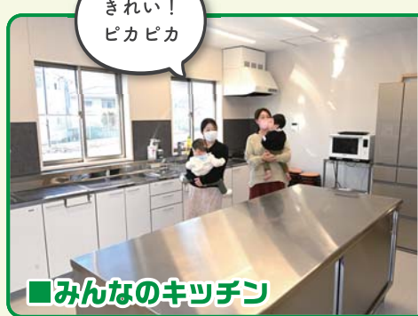
■みんなのキッチン

「豊かな人間関係の中で子育てを」との思いを込めた多世代交流型子育て支援拠点「あんなかスマイルパーク」が昨年4月、安中市原市にオープン。同市と市民団体が連携し、スマイルパーク(スマイル棟)の管理運営と地域子育て支援拠点「ニコニコ」の運営の2事業を展開している。今回は、同市に移住した親子2組が同施設を見学。みんなに優しい施設の魅力に触れた。