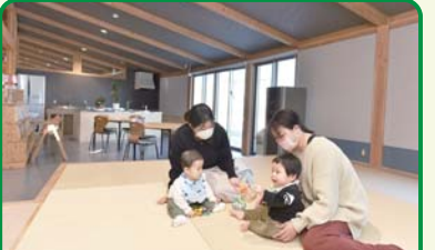
■みんなのくつろぎスペース