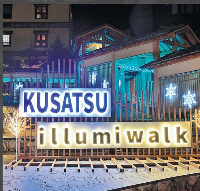
草津イルミウォーク 草津の冬を彩るツリーイルミネーションに合わせ、光の中を歩きながら楽しめる新しいイベントです(11月~2月)