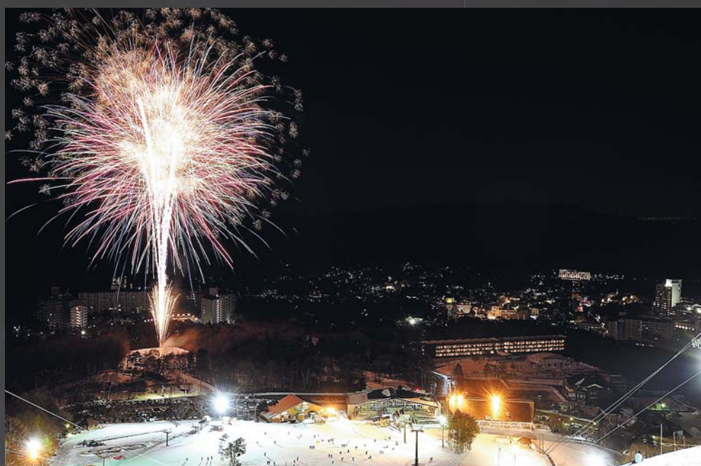
草津温泉冬花火 空気が澄んだ冬の時期に花火を打ち上げます(3月)