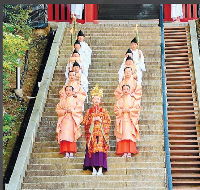
草津温泉感謝祭 一年の無病息災を願った故事にちなんだ祭は、温泉への感謝へと形を変えて現在に至っています(8月1・2日)