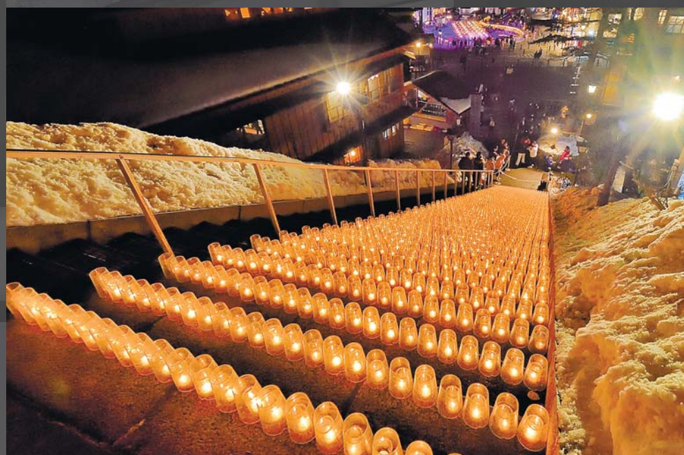
湯畑キャンドル 優しい明かりと湯畑の湯けむりが織りなす、美しい幻想的な光景をお楽しみください(毎月1~2回)