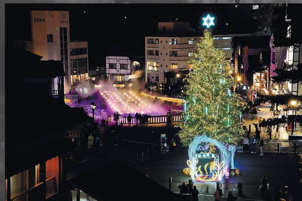
湯畑ツリー&イルミネーション 本物のモミの木に約4万個のLED装飾を施したクリスマスツリーを設置(11月~2月)