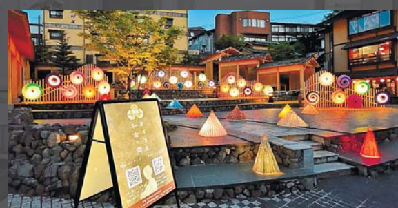
草津温泉和傘の舞 和傘を使ったオブジェを展示。この時期だけの特別感をご堪能ください(5月下旬)